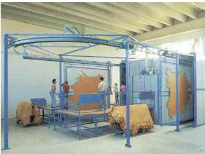
Figura 5: Proceso B

El sensor PCE-HGP es un medidor de humedad de material y está pensado para el uso profesional en la medición climatológica o la evaluación de daños de construcción. El medidor de humedad de material detecta, además de la humedad relativa y la temperatura ambiental, también la humedad absoluta de materiales y madera. A través de una tabla adjunta puede deducir el punto de rocío. Con este medidor se adquiere un aparato multifunción con una precisión alta para usarlo in situ. Otra ventaja se encuentra en su fácil manejo, las dimensiones y peso escaso. Se puede llevar el medidor de humedad de material en el bolsillo. Retirar la capucha protectora frontal, conectar el medidor a través de las dos teclas a la izquierda de la pantalla (presionar ambas teclas a la misma vez), seleccionar el modo de medición y se podrá empezar a medir. Así es como trabaja el sensor PCE-HGP, (ver figura 6).