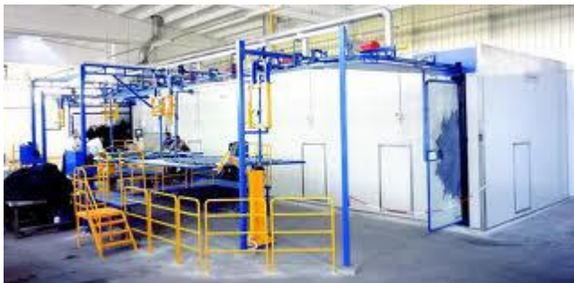
Figura 1: Toggling

o la evaluación de daños de construcción. Se probará en el cuero y ver cuál es la efectividad que tiene este sensor, (ver figura 1).