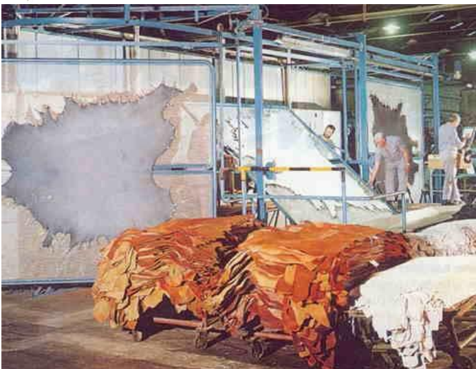
Figura 4: Proceso A