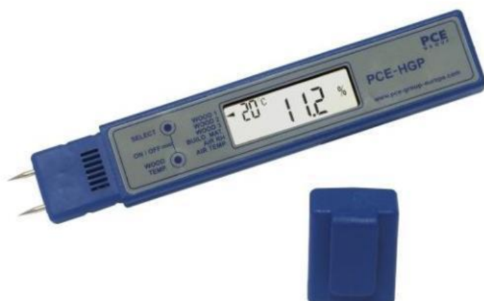
Figure 6: PCE-HGP

El desarrollo de este proyecto comienza en clavar los cueros hacia los marcos metálicos para que entren al secador de humedad. El cuero se estira para que tenga una uniforme humedad; en éste secador es difícil mantener siempre el mismo grado de temperatura y humedad para la piel es por ello que procedemos a realizar nuestra medida con el PCE-HGP. Donde nos muestra que humedad es la que tiene el cuero. Con las agujas hace una medición más precisa a comparación de los sensores para el ambiente. Por ejemplo el cuero puede empezar a los 70°C por la inmensa humedad que contiene sin embargo en el transcurso del secador pueden llegar a los 30°C [2]. Una vez que salen del secador pasamos a la medición donde nos encontraremos con varias medidas y ahí se procederá a aprobar si el cuero está listo para el siguiente proceso o aún le falta. Una vez que se encuentra la captura de nuestra humedad en la piel, el dato será enviado a un servidor donde se encuentra la base de datos con toda la información para que desde una navegador web se puedan visualizar los resultados de la captura o en una App para exportar los datos.