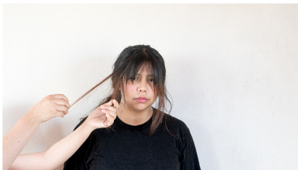
Figura 2. Straight Photography .

Sin embargo, a partir de la década de 1970, este enfoque comenzó a ser cuestionado por el posmodernismo. Artistas como Cindy Sherman plantearon que ninguna imagen es completamente objetiva, y que toda fotografía implica una construcción de la realidad. Desde esta perspectiva, la idea de una imagen totalmente neutral comenzó a perder fuerza frente a una visión más compleja y crítica.