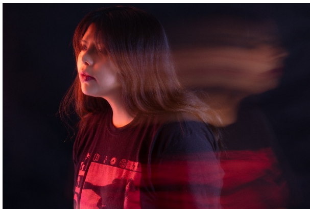
Figura 3. Fotografía Surrealista.

Por su parte, Philippe Halsman es conocido tanto por sus colaboraciones con Salvador Dalí como por la creación del jumping style , una técnica en la que fotografiaba a sus modelos en pleno salto, logrando imágenes dinámicas que rompían con la rigidez del retrato tradicional.