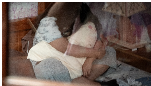
Figura 4. Fotografía Humanista.

En 1936 se fundó en Nueva York la Photo League, una organización de fotógrafos comprometidos con documentar la vida social desde una perspectiva crítica y humana. Finalmente, fotógrafas como Denise Bellon también aportaron a esta visión documental, realizando trabajos en distintos contextos como África, Asia y Europa, donde registraron realidades complejas, incluyendo las tensiones del contexto colonial.