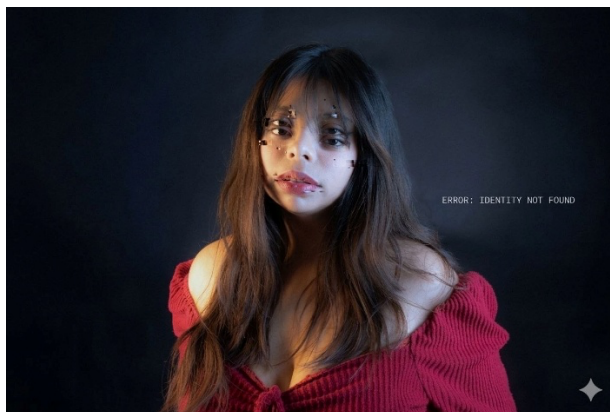
Figura 6. Fotografía Actual.

La fotografía busca expresar la distorsión de la identidad en la era digital. En un contexto donde existen múltiples versiones de lo que una persona “debería ser”, la identidad puede perder parte de su esencia. La imagen muestra a una persona de frente sobre un fondo oscuro; en su rostro aparecen múltiples ojos y deformaciones visuales, mientras que a un lado se encuentra el texto “Error: Identity not found”. La fotografía fue intervenida mediante herramientas de inteligencia artificial, incorporando recursos tecnológicos contemporáneos y un discurso relacionado con la construcción de la identidad en la actualidad (ver Figura 6).