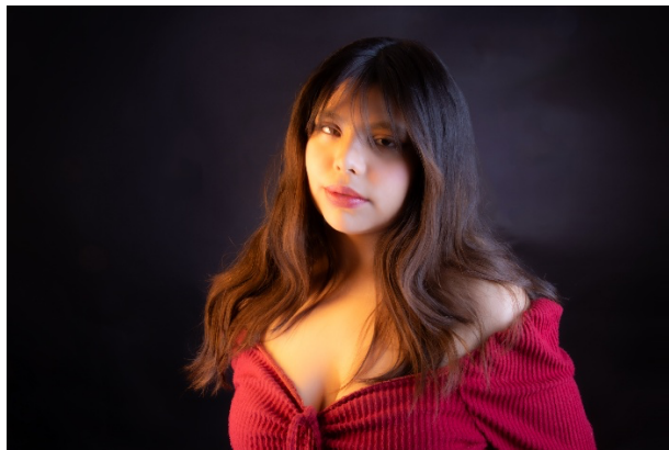
Figura 1. Pictorialismo.

El concepto de esta sesión fotográfica es “el yo”, representado a través de distintos periodos fotográficos. En el caso del pictorialismo, se presenta un yo idealizado, relacionado con la imagen mental que las personas construyen sobre nosotros. La fotografía busca transmitir una visión subjetiva y estética de la identidad, retomando características propias de esta corriente, como la suavidad visual, el efecto desenfocado y la intención interpretativa (ver Figura 1).