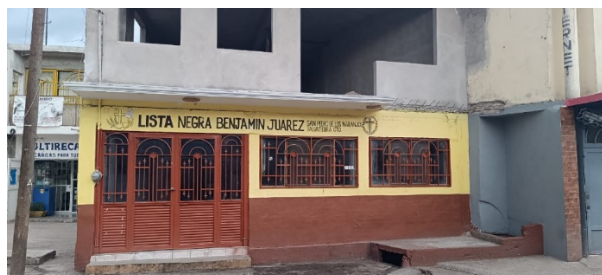
Figura 3. Velatorio comunitario y oficina "Lista Negra Benjamín Juárez"

Moreno et al. (2021) manifiesta que las organizaciones se basan en los principios de la Economía Social y Solidaria (ESS) se financian a través de las aportaciones de sus integrantes, donativos; entre otros; este tipo de actividades se pudieron apreciar en el grupo comunitario en cuestión en cuanto a la gestión económica hasta junio de 2024 se otorga un aproximado de $36, 000.00 (treinta y seis mil pesos mexicanos) dadas las aportaciones realizadas por los socios, estableciendo el proceso para su recepción mediante el doliente, el cual debe dar aviso al vocal de su manzana, de manera posterior este último dará aviso al presidente del comité el cual avisa a todos los vocales para que estos a su vez comuniquen al socio en turno (recolector) para que salgan a pedir las aportaciones, de manera posterior, el socio recolector se reúne con su vocal de manzana y hace entrega de las aportaciones económicas; el vocal de manzana se reúne el comité para que se realice el conteo del dinero y se le otorgue el beneficio económico al doliente, dicha aportación es entregada al lunes siguiente de la recolección (día de reunión en la oficina de la lista negra dentro del velatorio comunitario).