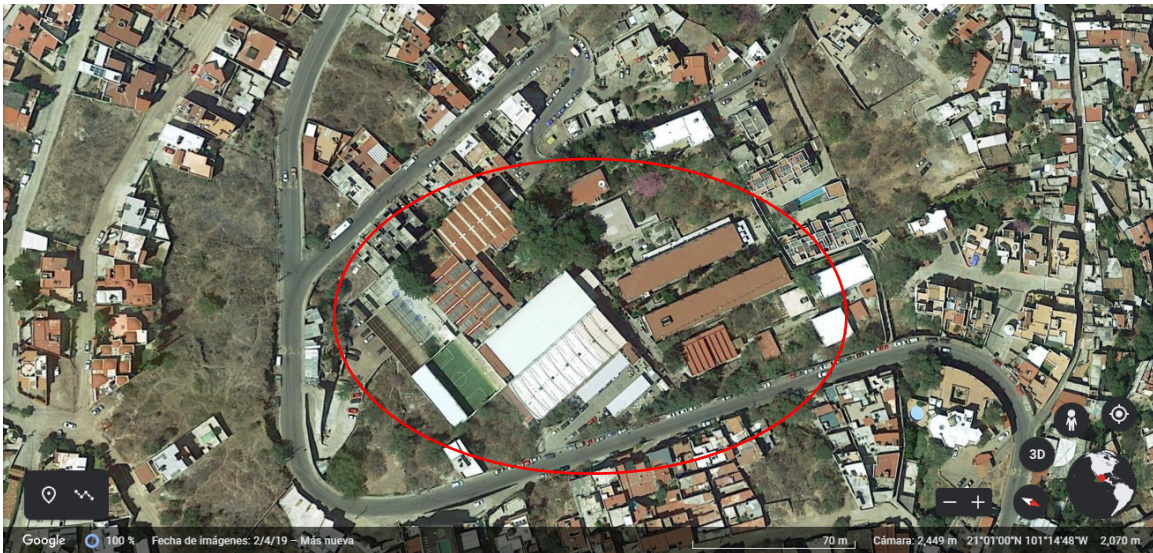
Figura 1. Escuela de Nivel Medio Superior de Guanajuato, México (Google Earth,2019).

para las pruebas fisicoquímicas antes y después de pasar por el filtro, se dividieron en 3 contenedores. El contenedor 1 siendo entonces el agua obtenida de un contenedor que había sido lavado con pastillas de hipoclorito de sodio y ahí fue recolectada el agua. El contenedor 2 proveniente del agua captada directamente del sistema de captación de agua de lluvia, mientras que el contenedor 3 es del mismo origen que el contenedor 2 con la única diferencia que esta misma paso por una membrana únicamente con la finalidad de eliminar objetos macroscópicos como plantas o ramas que se quedaran estancadas en el contenedor sin afectar las características del agua. Debido a la temporada la temperatura ambiente en el laboratorio y, por lo tanto, del agua recolectada oscilaba entre en los 26-30 °C como se mostrará posteriormente.