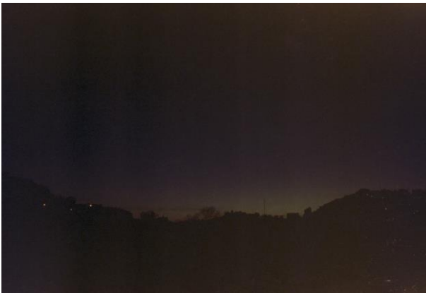
IMAGEN 3: visitantes