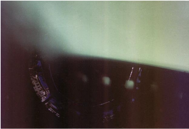
IMAGEN 2: Intruso