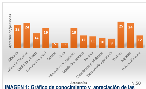
IMAGEN 1: Gráfico de conocimiento y apreciación de las artesanías del estado de Guanajuato, elaboración propia.

encuestados, es decir la preferencia, se basó en las compras realizadas o simple apreciación, cabe mencionar que los puntajes obtenidos difieren, ya que cada turista eligió más de un tipo de artesanía, donde, de los 50 turistas encuestados, 25 conocen y prefieren la artesanía textil, 24 turistas conocen y prefieren las artesanías de alfarería mayólica y los juguetes populares, 22 turistas mencionaron a las artesanías de alfarería en general, 19 encuestados respondieron que prefieren la artesanía de fibras duras y vegetales, 14 de ellos eligieron a la artesanía de cerámica y loseta, y en menor número de puntos en un rango de 9 a 12 turistas, están las artesanías de lapidaria y cantería; artesanía en madera, metalistería y orfebrería; dulces de alfeñique y talabartería y peletería, y por último con puntajes menores a preferencia de 5 turistas, están las artesanías de cerería y forja.