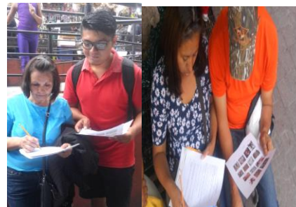
IMAGEN 3: Aplicación de encuestas en Mercado Hidalgo y Plaza de la Paz.