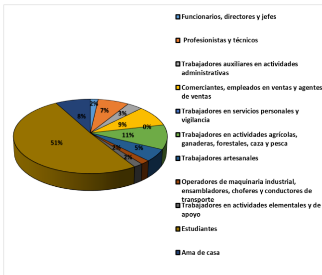
GRAFICO 1: División de Ocupaciones en México.

En el gráfico 2 se observa que en la mayoría de los casos el salario devengado por las familias es superior a sus gastos, sin embargo en algunos casos no es así, esto sucede principalmente en los hogares donde sus miembros se dedican principalmente a trabajos artesanales y a actividades agrícolas, ganaderas, forestales, caza y pesca.