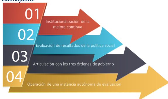
Figura 2. Retos del sistema de Evaluación y Monitoreo en Guanajuato.

Los retos que reconoce el Gobierno del Estado de Guanajuato aún son los siguientes: